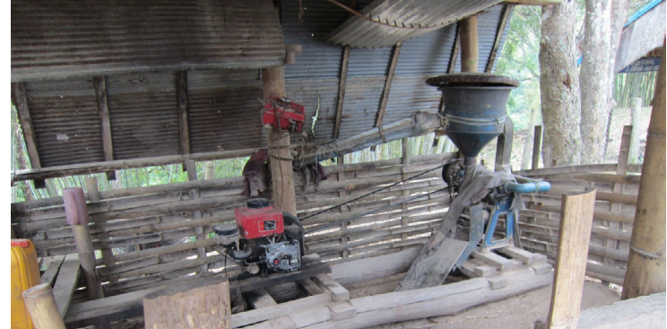
သဝီမဲးဂံၢ်ဘု

လၢကညီကီၢ်ကလံၤစိးတကပၤန့ၣ်ပူဟ့ၣ်လီၤဆိစ့တအိၣ်ဘၣ်. အဃိတဘျီတခိၣ်သဝီဖိ တဖၣ်ဟဲးလီၤဆိစ့လၢ အဝဲသ့ၣ်သကိး မ့တမ့ၢ် အဘူးအတၢ်တဖၣ်အိၣ်ဒီးတဘၣ်လိၣ်ဟ့ၣ် က့ၢ်စ့အ့ၣ်ဘၣ်. လၢသဝီပူ တံးဆိတံးပုၤကျဲးအိၣ်လိၣ်ဖျါဒီး ကျဲးတဖၣ်အါဆိတံးအိၣ်ဃုဒီး တံးအိၣ်လၢအိၣ်ဒီးအဒါန့ၣ်လီၤ. တဘျီ တခိၣ် ပုၤကူလဲၤမၤကတၢ်တဖၣ် (မ့ၣ်ဒၣ်ကညီဖိ) လဲၤလၢသဝီပူ လၢကလဲၤဆိညၣ်ဃုၤ တံးကူတံးကၢ ဒီး တံးအိၣ်အဂုၤအဂၤတဖၣ်န့ၣ်လီၤ. တဘျီတခိၣ်သဝီဖိဘၣ်တနီၤနီၤလဲၤဟးလၢသဝီအိၣ်ဒီးအါန့ၣ်မးဒီးတသိ (မ့တမ့ၢ်လဲၤလၢဝဲ- အဒိ- တီအူ မ့တမ့ၢ် မိၤခဲအိၣ်လၢကရံၣ်န့ၣ်) လၢကပူအံၣ်သ့ၣ်. ညၣ်အုၣ်. monosodium glu- tamate ဒီး သဲးသ့ၣ် (အဂုၤအဂၤတဖၣ်လၢသဝီအိၣ်ဘူးတဖၣ်- အဒိ- သဲးသ့ၣ်) တဖၣ် န့ၣ်လီၤ. တဘျီတခိၣ် အဝဲသ့ၣ်ကူလဲၤမၤကတၢ်ဟုးလၢ တံးဖိတံးလဲၤတဖၣ်အံၣ် လၢကသူကျိၣ်စ့အလီၤ န့ၣ်လီၤ. သဝီဖိတဖၣ် ထၢဖိၣ်ဝဲဖိၣ် တံးအိၣ်လၢပုၤပူဒ်သိး ဘီၣ်ဒီး ဂီၢ်မ့ၣ်တဖၣ်လၢပုၤပူန့ၣ်လီၤ.