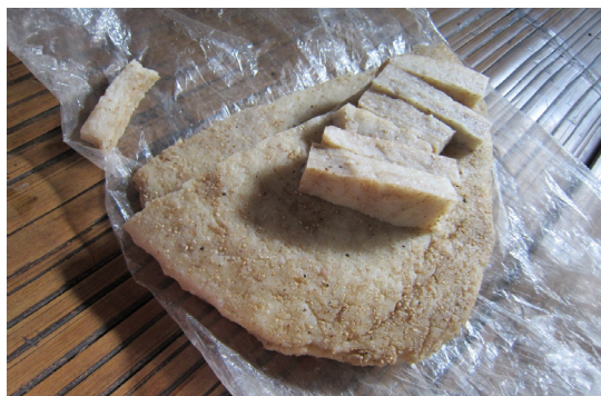
မ့တီၣ်ပံာ်

အပူၤကွဲၣ်န့ၣ်တဖၣ်န့ၣ် ပူသဝီသဝီဖိတနီၤ လဲၤသုးလီၤသုးကျဲဆူကီၢ်ကျိၣ်တဲၣ်ဒီး ခဲအံၤအိၣ်လၢ ဘၣ်ကီဘၣ်ခဲဒဲကဝီၤပူၤန့ၣ်လီၤ. သဝီဖိတနီၤ မၤတၢ်ဒိ ပုၤသုးလီၤသုးကျဲပုၤမၤတၢ်ဖိဖိ ထံကီၢ်လၢ အအိၣ်ဘူးန့ၣ်လီၤ. သဝီဖိတနီၤ လဲၤသုးလီၤသုးကျဲဆူ USA စီဖျါ ဘၣ်ကီဘၣ်ခဲတၢ်သုးလီၤသုး ကျဲအဖိလဲၤန့ၣ်လီၤ. ဟံၣ်ဖိယီဖိတနီၤ (အါဒၣ်တက့ၢ်) ဒီးန့ၣ်ဘၣ် ကျိၣ်စ့ၤတၢ်မၤစၢၤလၢ အဟံၣ်ဖိ ပီဖိဆူလၢကီၢ်ကျိၣ်တဲၣ် မ့တမ့ၢ် ထံဂုၤကီၢ် ဂၤန့ၣ်လီၤ.