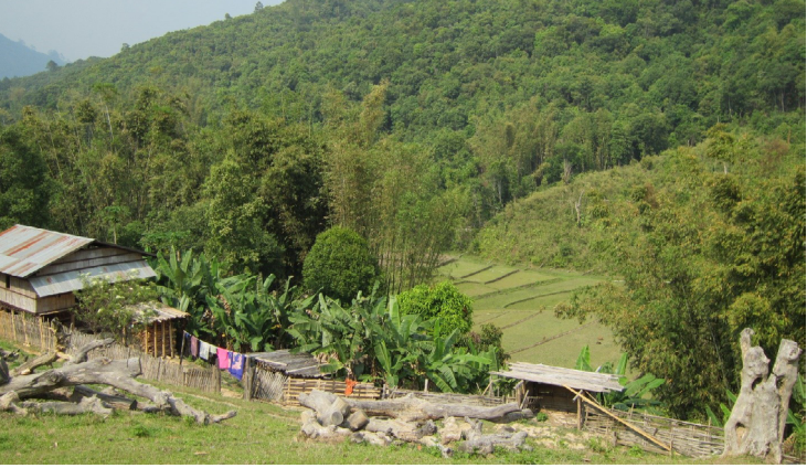
ထံးစိလါတံးလုၣ်ခိၣ်အစီခိၣ်- ဘုတံးသ့ၣ်တံးဖျးစ့ဟဲန့ၣ်လါ တံးသ့ၣ်အဲလါထံးတံးက့ၢ်(စံးပျီ)ဒီးဒုးတဖၣ်

ဒုးစံးပျီလါတံးလုၣ်ခိၣ်န့ၣ် ဘၣ်တံးမၤပျီအိၣ်လါ လါယုၤအါရဲၣ်တုၤ လါမးရှူးန့ၣ်လီၤ. ကကျါပျီ ဝဲဒုၣ်တံးထုၣ်တံးဘိတဖၣ်အိၣ် ဘၣ်သ့ၣ်ပူမၤတံးဖိအဘူးအဲလဲဒီး မၤယုထီၣ်တံးထုၣ်တံးဘိ ဖဲတံးကိၣ်ခါအဆါကတီၢ်န့ၣ်လီၤ. ညီန့ၢ်ဖဲလါအ့ၣ်ဖျးန့ၣ် တံးဒုၣ်ဒုးတဖၣ်ဝဲဒီး ဟံၣ်ခိၣ်အစီတဖၣ် န့ၣ်ဂ့ၤထီၣ်ဝဲန့ၣ်လီၤ. (ဖဲပူဒုၣ်ထီၣ်တံးအဆါကတီၢ်ဒုးအိၣ်ထီၣ်ခါဘိဒုၣ်ဒုးအိၣ်စဲး(ကလဲၤဘၣ်အါ) တဖၣ်လါကလဲၤကျါ ဒီဖျါတံးခုၣ်ထီၣ်အယီန့ၣ်လီၤ.) တံးအံၤ တံးမၤလါအဲကီၢ်အဲဒီး ဒွဲၣ်တံးတၢ်တဘျီဝဲအဲလီၤခဲ ဘၣ်မၤကဒီးအိၣ်န့ၣ်လီၤ. မ့ၢ်လါ တံးထုၣ်တံးဘိလါ တအူ လဲၣ်ထီၣ်တဖၣ် (လီၤဆီဒုၣ်တံး သ့ၣ်ထုၣ်ဆဲးဖိတဖၣ်ဒီး သ့ၣ်တပျီတဖၣ်) ဘၣ်က့ၢ်ပပ်ဖိၣ်တ ပူဃီဒ်သိးကဒွဲၣ်ထီၣ်က့ၢ်အိၣ်အဲကီၢ်န့ၣ်လီၤ. ဖဲလါမ့ၢ် တံးစ့ၢ်လီၤသီအဆါကတီၢ်န့ၣ် ဘုချံ တဖၣ် တံးသ့ၣ်လီၤအိၣ်လဲန့ၣ်လီၤ. ဖဲတံးစ့ၢ်ခါအဆါကတီၢ်န့ၣ် နီၣ်မံၤထီၣ်လါစံးပျီပူ တချူးလါ လါနီၣ် ဝဲဘၣ်ပူမၤက့ၢ်ဘုအဲခါန့ၣ်လီၤ.