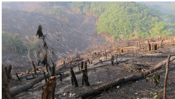
ခွဲၢ်အူမ့ၢ်အူလၢနီၣ်ပျီ(ဖးခး)ဒီးနီၣ်ပျီလၢမ့ၢ်အူအိၣ်ဝဲအလီၤခဲ