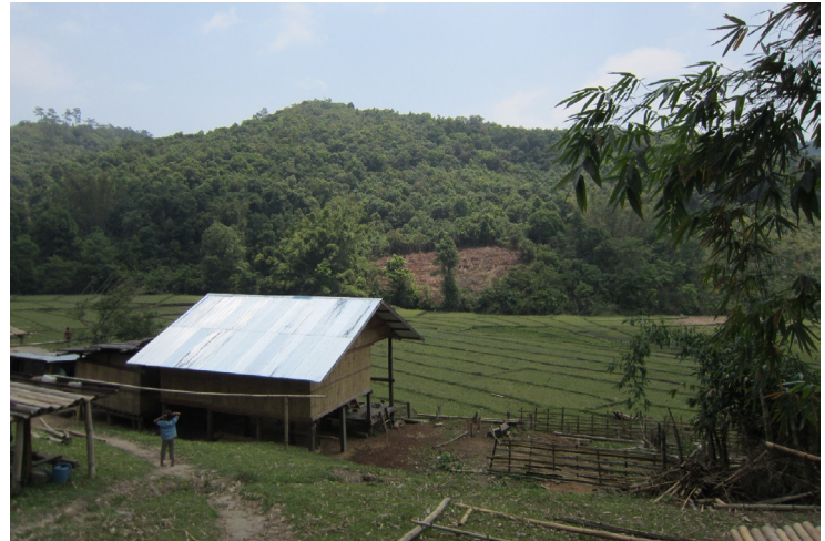
စံၣ်ပျီတဖၣ်

သဝီအဝဲအံၤအိၣ်ဝဲဒၣ်လၢတၢ်မဲၣ်ညါသးကျိၤလၢအအိၣ်ဘူးဒီးဒၣ်ဒါ(front-line)လၢစုကဝဲ၊ တၢ်သဘံၣ်ဘျီအလီၤလၢကီၢ်ပယီၤကလံၤစိးတကပၤန့ၣ်လီၤ.တၢ်ဂ့ၢ်တခါလၢလီၤသးစဲကတၢ်တ ခါလၢပထံၣ်ဘၣ်ဝဲန့ၣ်မ့ၢ်ဝဲဒၣ်တၢ်လီၣ်အဝဲအံၤန့ၣ်မ့ၢ်ဝဲတၢ်ဒုးကဲထီၣ်ကဒါက့ၤဘၣ်ဆၣ်တၢ်ဘၣ် ဒိဘၣ်ထံးလၢအကဲထီၣ်တဖျါဝဲဘၣ်.ဆူမဲၣ်ညါတၢ်ဂ့ၢ်တၢ်ကျိၤတၢ်ဂ့ၢ်လီၤတၢ်လီၤဆဲးတဖၣ်တြီ ဃာ်ပာ်စဲလၢတၢ်ဘၣ်တၢ်ဘၢအဂီၢ်န့ၣ်လီၤ.