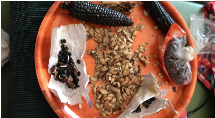
ဟီၣ်ကဝီတံးချဲတံးသ့ၣ်တဖၣ်

တံးဃုအိၣ် တံးမဲၤလၢလၢပုၤပူန့ၣ်အဘူးအိၣ်သန့ၣ်က့ၢ် မ့ၣ်မဆိတနံၤအံၣ်. လၢသဝီအိၣ်အဃၢၤ တံးမဲၤလၢအိၣ်တံး ထဲဒၣ်စ့ၤကဲးဖိန့ၣ်လီၤ. ဟံၣ်ဖိဃီဖိတဖၣ် လဲၤဃုအိၣ်တံးဒီးတံးလုၣ်န့ၣ်ဂီၢ် ဘၣ်ဒီး ဃုအိၣ်ဆၣ်ဖိကီၢ်ဖိလၢ အဆဲးဒ်သိး ညၣ်ဖိ. ဆဲၣ်တဖၣ်. ဒုတဖၣ်အိၣ်လၢထံဖိကျိၤပူဒီး တံးအံၣ်ကဲးဘူးလၢ အဝဲသ့ၣ်အတၢ်အိၣ် အဂီၢ်န့ၣ်လီၤ.